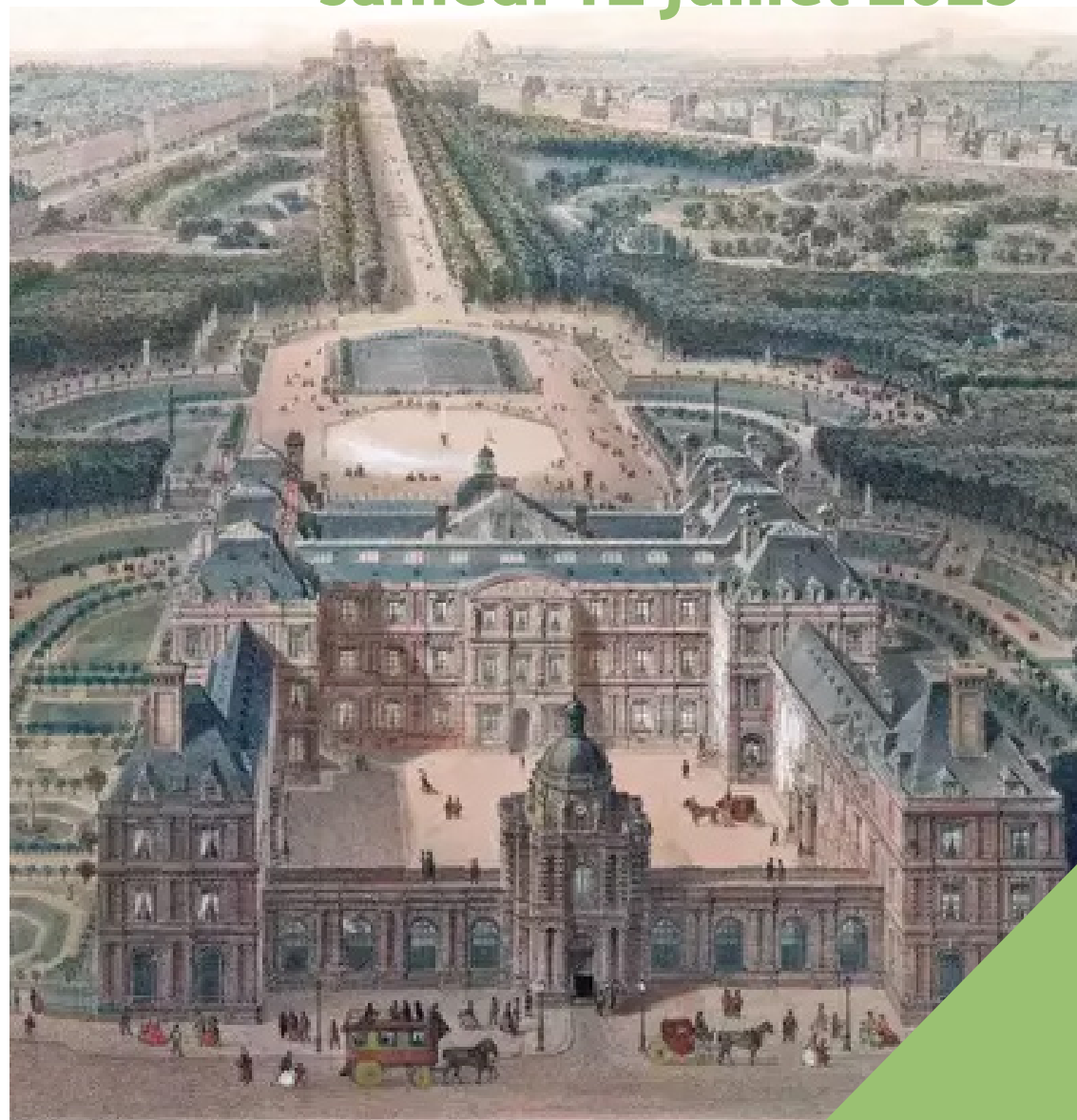
PALAIS ET JARDIN DU LUXEMBOURG

Lien vers billetterie en ligne sur Helloasso - journée au Sénat