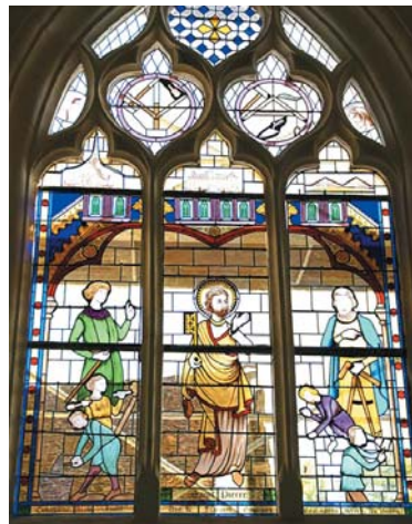
Création pour l'église de Montaulin