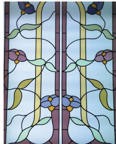
Création contemporaine pour un particulier

Aurore réalise également des panneaux, des portes des tables basses pour des particuliers. Ceux-ci peuvent s'inspirer pour leur choix de motifs figuratifs ou abstraits. Elle peut aussi leur faire des propositions en fonction de leur intérieur ou de leurs aspirations.