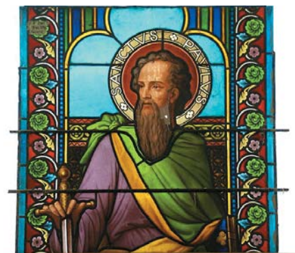
Saint Paul d'Ay en Ardèche actuellement en réfection

La restauration tout d'abord. Aurore a une véritable passion pour les vitraux anciens.