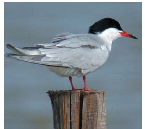
Sterne Pierregarin