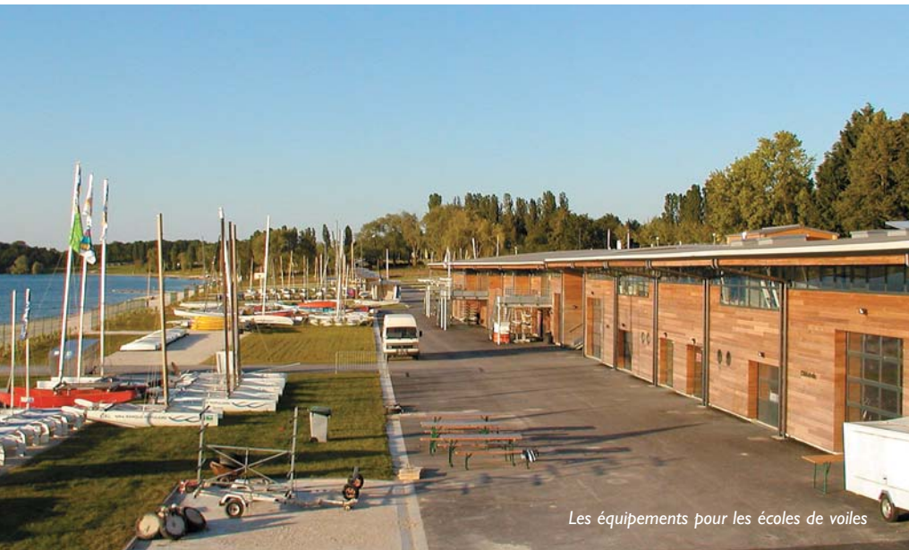
Les équipements pour les écoles de voiles

Le site de Mesnil-Saint-Père fait l'objet d'une grande campagne de requalification, dont l'inauguration de la Maison des Lacs, le 30 juin prochain, marque une étape importante.