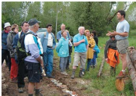
Samedi 13 mai 2006 : randonnée à Courteranges pour la Semaine du Bois

Nous vous remercions d'y participer toujours aussi nombreux !