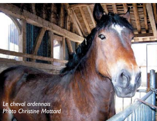
Le cheval ardennais

Ferme de la Marque - Champ-sur-Barse Renseignements: tel /fax 03 25 41 47 97 www.fermedelamarque.com