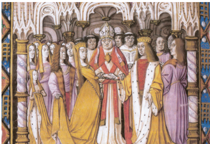
Mariage de Henri V et Catherine de France

Les délais requis entre les fiançailles et le mariage étant accomplis, le dimanche 2 juin 1420, le roi d'Angleterre épousa Madame Catherine de France en l'église de la paroisse sur laquelle résidait le roi d'Angleterre, l'église Saint-Jean-au-Marché. Le mariage fut célébré par l'archevêque de Sens, Henri de Savorsy.