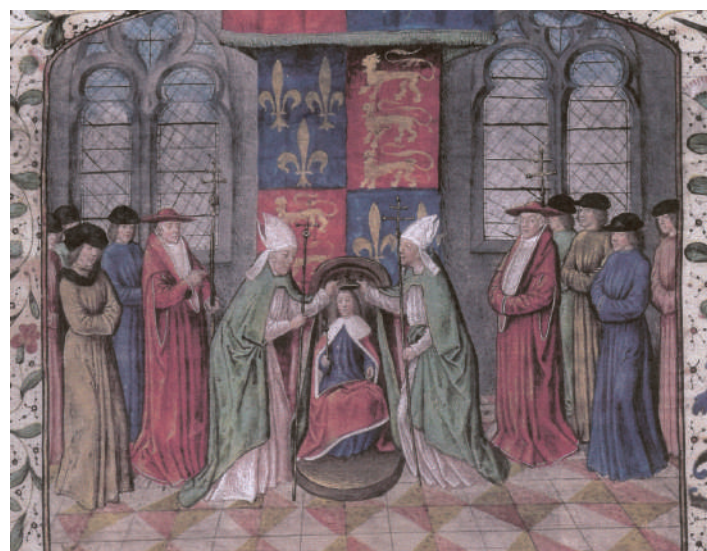
Couronnement de Henri V

Inquiet de l'avance des Anglais confirmée par la prise de Pontoise le 31 juillet 1419 le Duc de Bourgogne, Jean Sans