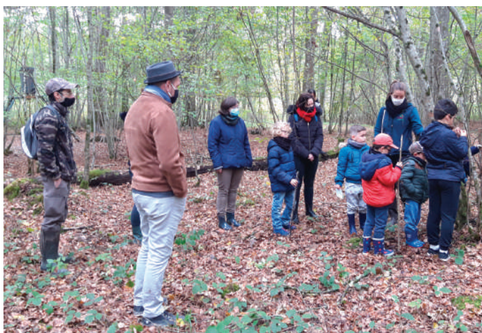
Sortie en milieu forestier à destination du grand public et des enfants, réalisée en partenariat avec le CRPF

Des réunions d'information et de sensibilisation, ainsi que des sorties sur le terrain, sont organisées dans le but de rencontrer les acteurs locaux. Par ailleurs, le Parc, qui comprend 65% de sa surface forestière totale située en Natura 2000, s'implique au quotidien dans l'animation forestière auprès des propriétaires privés et des gestionnaires.