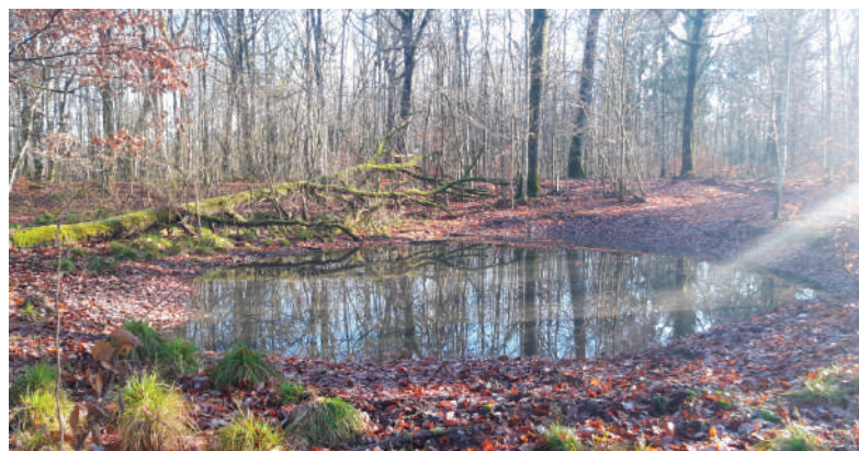
Mare restaurée en novembre 2019 dans la forêt du Grand Orient

Pour cela, des contrats Natura 2000 peuvent être contractualisés par les propriétaires et les gestionnaires pour 5 années, afin de mettre en œuvre des actions favorables à la conservation des habitats et espèces d'intérêt communautaire. La restauration de mares en est un très bon exemple.