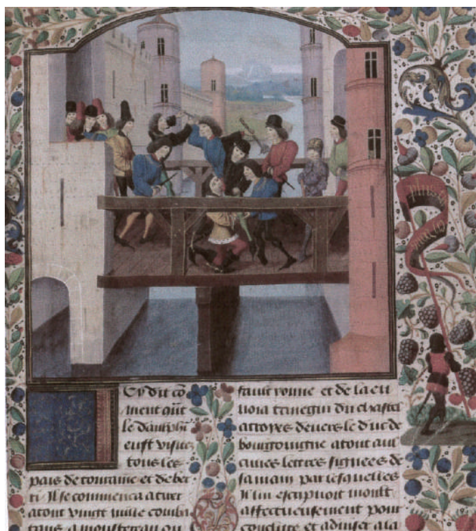
Assassinat de Jean sans Peur à Montereau

Peur et la famille royale, Isabeau de Bavière, Charles VI et leur fille Catherine de France quittent Paris, font étape à Provins, Nogent-sur-Seine le 9 août, logent à Marigny-le-Châtel le 10 et arrivent à Troyes le 11 août 1419, ville jugée sûre par le Duc de Bourgogne.