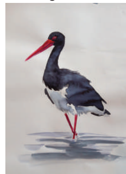
Aquarelle d'une Cigogne noire (c) L. Paix

Sur la ZPS «Lacs de la Forêt d'Orient», les oiseaux liés aux étangs ont été au cœur des inventaires en 2017 et 2019 (Râle d'eau, Blongios nain...), tandis que les Cigognes noires sont suivies chaque année dans le cadre des suivis de la RNN de la Forêt d'Orient. En 2021 et 2022, ce sont le Milan noir et la Pie-Grièche écorcheur qui feront l'objet de suivi afin d'estimer le nombre d'individus présents sur la ZPS et de constater l'évolution de leurs populations.