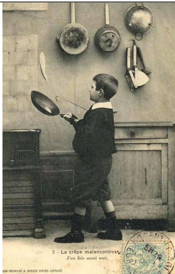
2 - La crêpe malencontreuse, J'en fais aussi moi.

Aujourd'hui, celui qui retourne sa crêpe avec adresse, qui ne la fait pas tomber à terre, ou qui ne la rattrape pas sous la forme