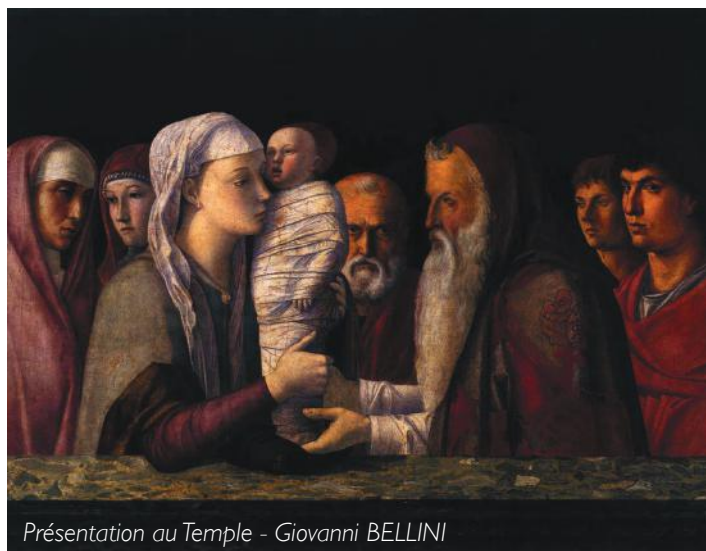
Présentation au Temple - Giovanni BELLINI

Alors on organise des processions aux chandelles le jour de la chandeleur.