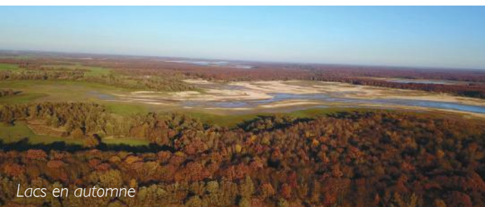
Lacs en automne

À l'image d'une poésie, changeant de définition et de fonction selon les époques, le paysage est une représentation que l'homme se fait de son territoire sous différentes formes et différentes échelles. Chacun est acteur du paysage dans lequel il vit qu'il soit usager, commerçant, artisan, agriculteur, industriel mais aussi aménageur, promoteur, technicien réseau ou encore élu, comme un poète écrivant sa prose et arrangeant l'expressivité de la forme et le choix des mots pour en donner un sens personnel... C'est là toute la complexité ! Ainsi, le Parc s'attache à observer et faire connaître l'évolution de ses paysages intimement liés aux actions de l'homme. L'enjeu est donc de préserver ces entités et les éléments qui les composent, mais également de les réhabiliter voire d'engager une reconquête d'espaces d'intérêt paysager et biologique à l'image de la « naturalité » dégagée par les grands lacs-réservoirs.